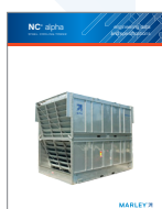
NC Alpha Splash-Fill Cooling Tower