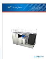
NC Fiberglass Engineering Data and Specifications

有关 NC 冷却塔的更多信息 — 包括工程示意图、数据、布置要求和其它信息 — 可向您的Marley销售代表索取副本或从SPXCOOLING.COM网站下载: