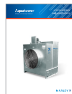
Marley Aquatower® Cooling Tower