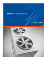
Marley MD Cooling Tower

SPX 冷却技术公司提供全系列的行业领先产品 — 通过我们卓越的支持和创新的设计帮助您最有效地使用您的冷却工艺。查看SPX 冷却技术公司的下列其他产品。