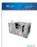
NC Steel Engineering Data