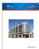
NC Steel Specifications