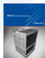
Marley AV Cooling Tower